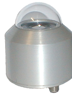
Ausführung im wettergeschützten Gehäuse für Ausseneinsatz FLD7 33-UVE Datenblatt siehe Kapitel Meteorologie