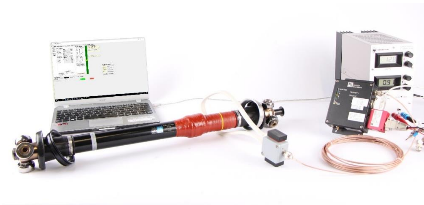
Abbildung 3: Enorme Abstände zwischen Rotor und Stator erlauben auch den Betrieb auf der Teststrecke mit großen Einfederungen