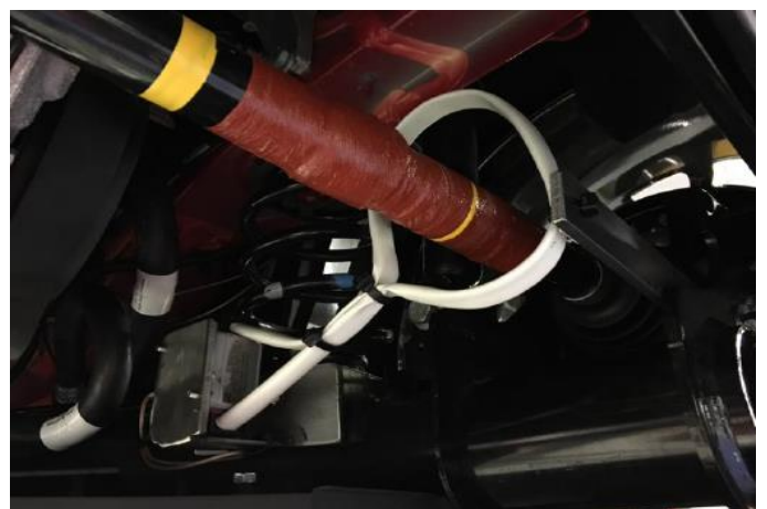
Abbildung 1 Einfache Montage der Antenne im Fahrzeug

Statorschleife, die im Fahrbetrieb leicht etwas verrutschen kann.