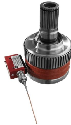
Abbildung 1: Kompensierter Getriebeflansch mit induktiver Versorgungsantenne (weitere Miniaturisierung der Antenne möglich)