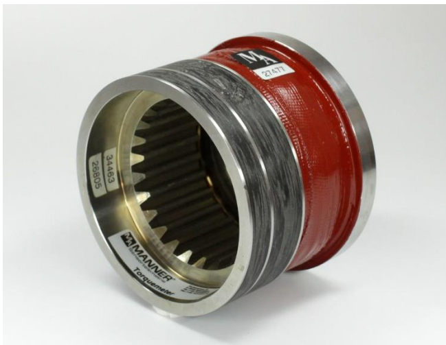
Abbildung 3: Applizierter Getriebeausgangsflansch (Messbereich 3000 N·m)